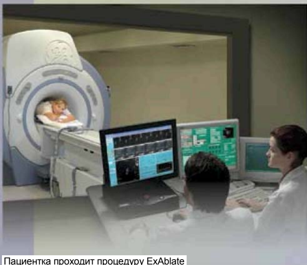
Пациентка проходит процедуру ExAblate

Во время процедуры магнитно-резонансный томограф создает изображения, позволяющие врачу объемно «видеть» миому и соседние с ней органы, отслеживать изменения температуры на ткани в режиме реального времени и наблюдать, какие участки уже были обработаны — и все это без внешних хирургических вмешательств.